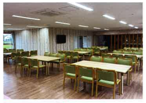
食堂・ダイニング 明るく広い食堂でゆっくりと食事ができます。