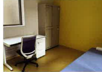
看護室 看護師が常時利用者の健康管理を担っております。