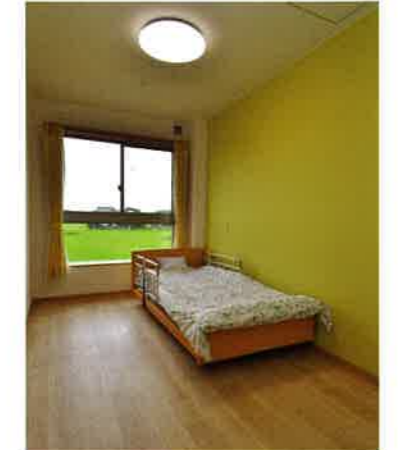
居室 全室個室でエアコン・テレビが完備され、ゆったりと過ごせます。