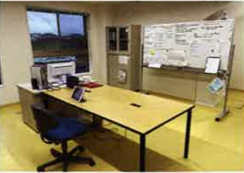
スタッフルーム 生活支援員の部屋です。各階にあります。