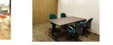
相談室 プライバシーが守られる部屋となっております。