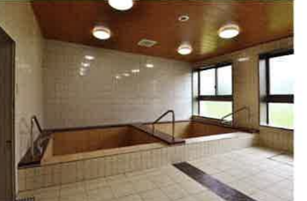
浴室 広く清潔な浴槽でゆっくりと入浴できます。