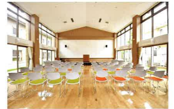
訓練・作業室 生活介護の日中支援を行う部屋です。運動や映画鑑賞なども行います。