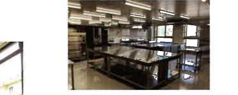
調理室 栄養バランスを考え美味しい食事を提供します。